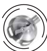
Cuchilla de Acero Inoxidable