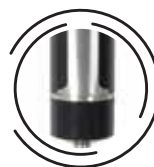
Panel decorado con Acero Inoxidable