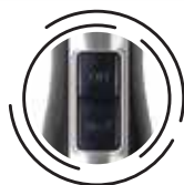
Controlador de 20 vel. variable con función turbo "Max"